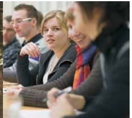
TeilnehmerInnen auf der Vorstandssitzung