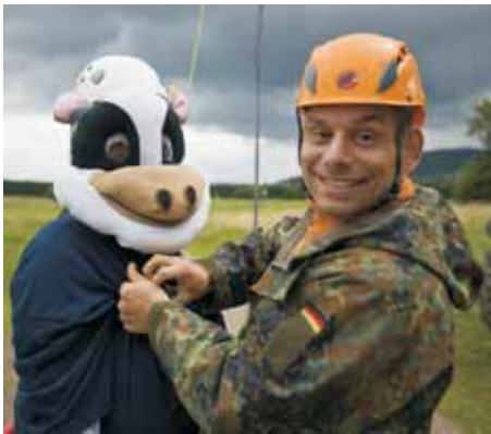
Wilma auf der Landesgartenschau