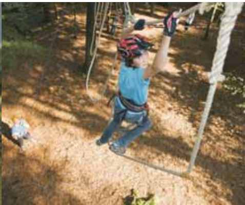
Beim Klettern in Breckerfeld