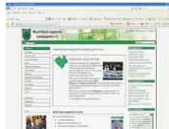
WLL-Homepage in neuem Glanz

Das Referat verfolgte aber nun das Ziel, den