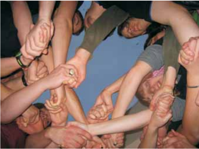
Der Spaß darf bei der WLL-Vorstandsarbeit nicht zu kurz kommen!

Der Landesvorstand ist für die Umsetzung der Beschlüsse und Arbeitsaufträge verantwortlich, die auf der Landesversammlung getroffen werden.