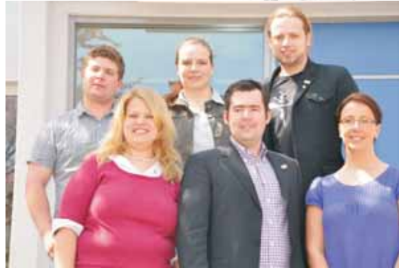
Seit 25.04.2010 der neue Bundesvorstand der Landjugend

Unter anderem in den Arbeitskreisen „Agrar“ und „JumPo“ (Jugend macht Politik) haben die Landesverbände, und somit natürlich auch die WLL, die Möglichkeit, die Arbeit des BDL in diesen