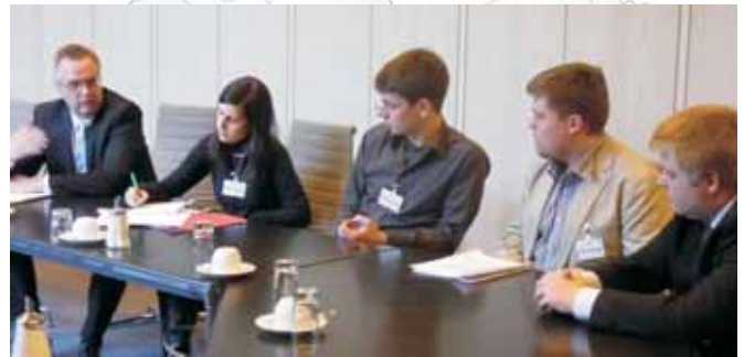
WLL-Referat im NRW-Landtag im Gespräch mit MdB Hubert Kleff

Das Referat Jugendpolitik trifft sich, um jugendpolitische Themen zu diskutieren und Sitzungen des AK Jumbo auf Bundesebene vor-