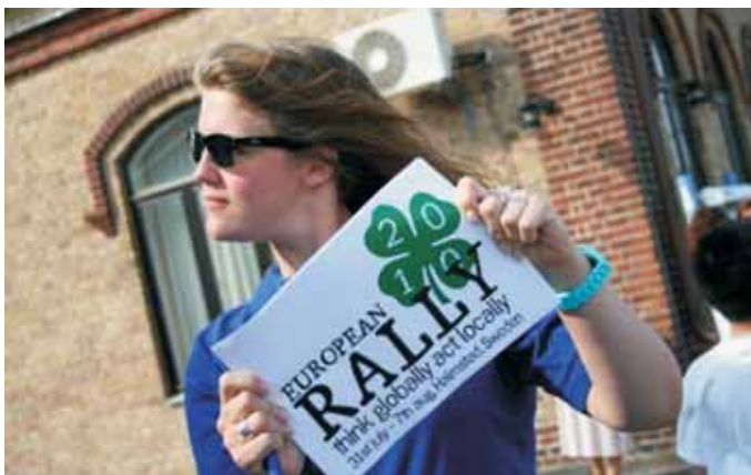
Teilnehmerin beim europäischen Landjugend-Treffen "European Rally"