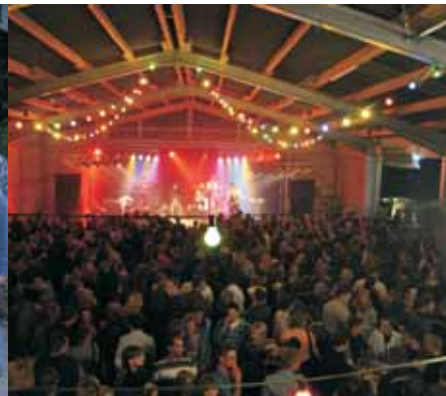
Scheunenfest der LJ Halver