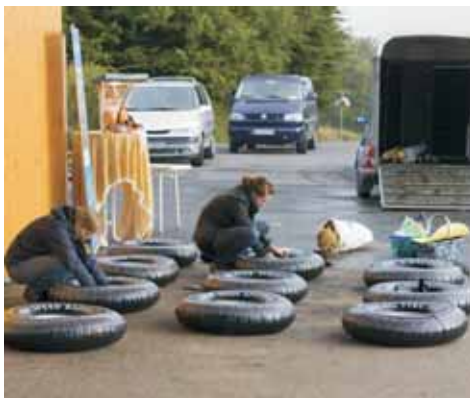
WLL auf der Landesgartenschau