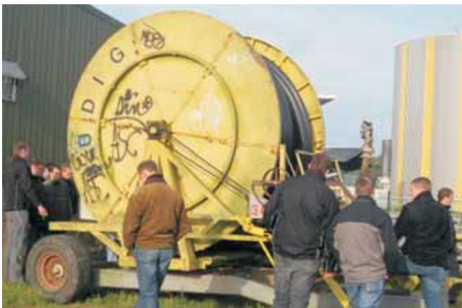
Landjugend auf Agrartour in Norddeutschland

Zudem organisieren die Mitglieder dieses WLL-Referats auch Exkursionen wie die Agrartour oder diverse Besichtigungen.