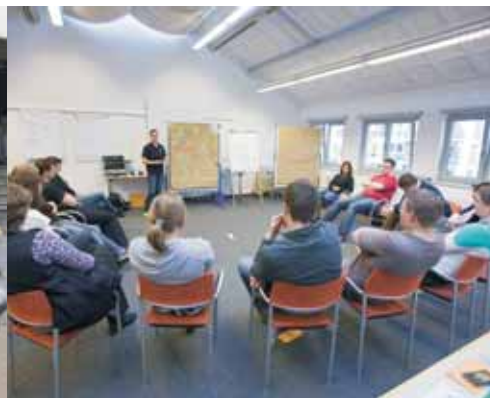
TeilnehmerInnen beim Seminar