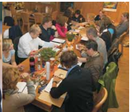
Landesvorstand plant für 2011