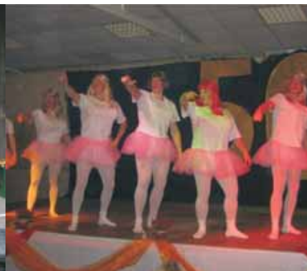
40. Jubiläum der LJ Osttünen