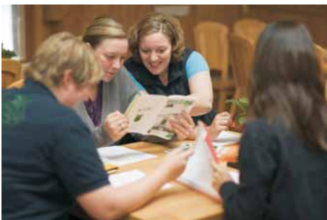
Referat Öffentlichkeitsarbeit arbeitet an der MomentMal

Die WLL nutzt auch die Mikroblogging-Plattform Twitter, um Neuigkeiten schnell an ihre Mitglieder