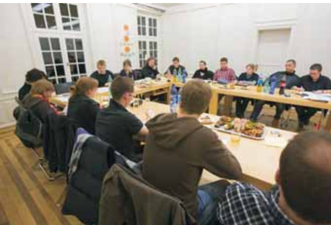
Landesvorstandssitzung im großen Sitzungssaal des WLV in Münster

Außerdem werden WLL-VertreterInnen in die Beiräte der Landwirtschaftskammer Nordrhein-Westfalen delegiert.