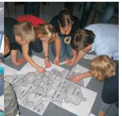
Landesvorstand auf Klausur