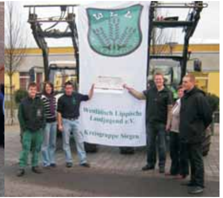
Spendenaktion der LJ Siegen