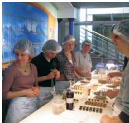
WLLer stellen Pralinen her