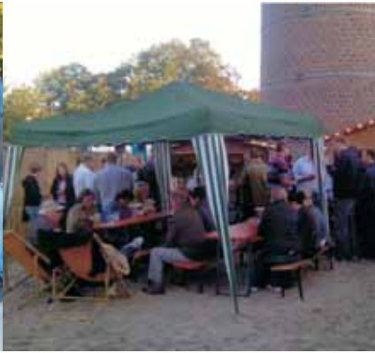
Beachbar der LJ Lengerich