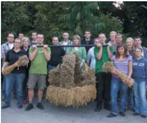
Die Erntekrone der LJ Borgeln