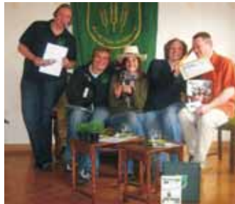
AK Film auf dem Set

Im Arbeitskreis Film wurde der neue WLL-Film "WLLmania. Das Landjugendportrait" produziert. Dafür haben die Filmemacher bereits seit 2009 viele Drehtermine wahrgenommen, Film- und Fotomaterial gesammelt, gesichtet, schaupielerische Szenen eingeübt und gespielt, gedreht, geschnitten und alles am Ende mit Musik hinterlegt. Bei der Arbeit an unserem Film haben uns sehr viele Menschen unterstützt, die hier gar nicht alle aufgeführt werden können.