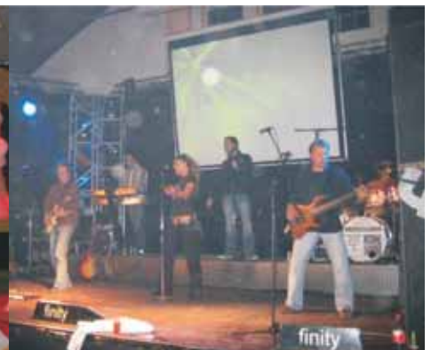
Osterball der LJ Neuengeseke