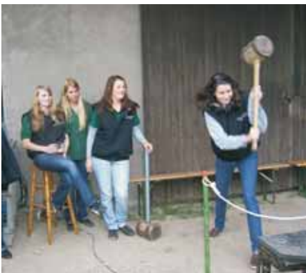
Scheunenfest der LJ Breckerfeld