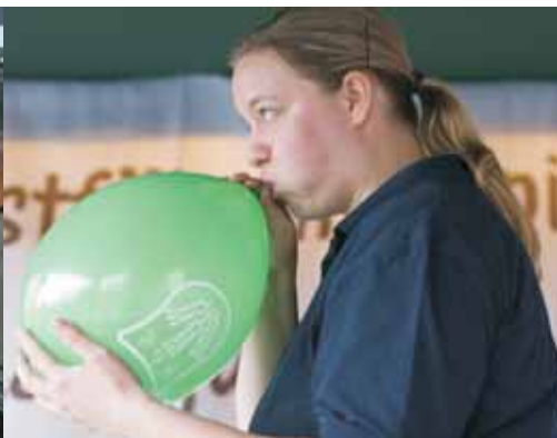
Voller Einsatz für die WLL